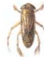
Ruderwanze Fam. Corixidae 5 – 15 mm