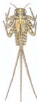
Larve einer Eintagsfliege hier: Larve der Heptagenia sp. 9 – 14 mm