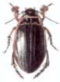
Schwimmkäfer hier: Gelbrandkäfer Dytiscus marginalis 30 – 35 mm