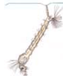
Larve einer Stechmücke hier: Culex sp. etwa 10 mm