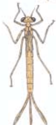
Larve einer Kleinlibelle hier: Larve der Binsenjungfer Lestes sp. 10 – 20 mm + 8 – 10 mm (Schwanzblätter)