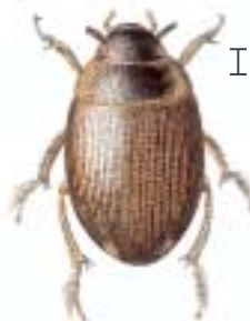
Wasserkäfer hier: Laccobius bipunctus ca. 3 mm