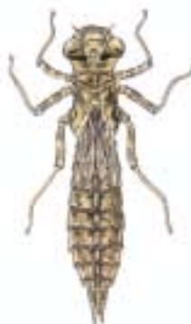
Larve einer Großlibelle hier: Larve der Mosaikjungfer Aeshna sp. 35 – 45 mm